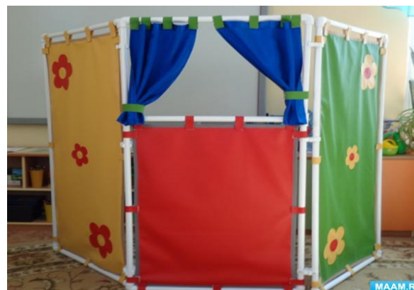
РАЗГРАНИЧЕНИЕ ПРОСТРАНСТВА ШИРМЫ