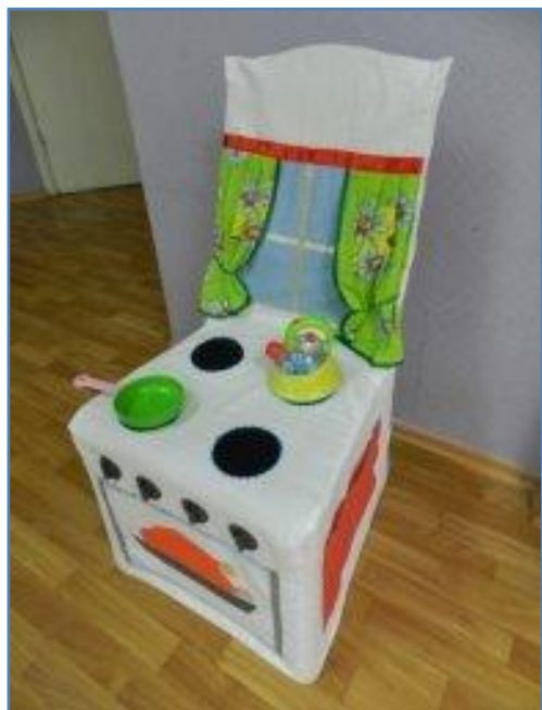
ТРАНСФОРМИРУЕМЫЕ ПРЕДМЕТЫ СРЕДЫ